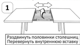
Схема раскладки столешницы раздвижного стола