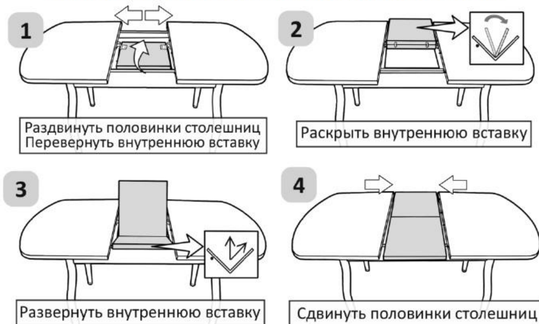
Схема раскладки столешницы раздвижного стола

ВАЖНО. Во избежание самопроизвольного раздвижения половинок столешниц ОБЯЗАТЕЛЬНО переключите фиксаторы в состояние ЗАКРЫТО .