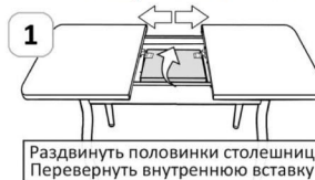
Схема раскладки столешницы раздвижного стола